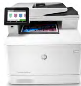
Impresora HP Color LaserJet Pro M479fnw

Impresora con seguridad dinámica habilitada. Para ser exclusivamente utilizada con cartuchos que utilicen un chip original de HP. Es posible que no funcionen los cartuchos que no utilicen un chip de HP, y que los que funcionan hoy no funcionen en el futuro. Obtenga más información en: http://www.hp.com/go/learnaboutsupplies