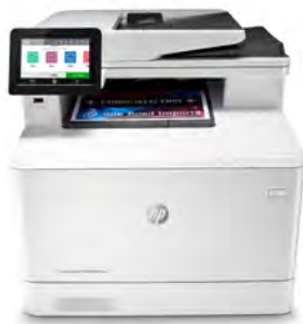
Impresora HP Color LaserJet Pro M479dw

El éxito profesional es sinónimo de una forma de trabajo más inteligente. La impresora multifunción HP Color LaserJet Pro M479 se ha diseñado para que puedas centrarte más en el crecimiento de tu empresa y situarte un paso por delante de la competencia.